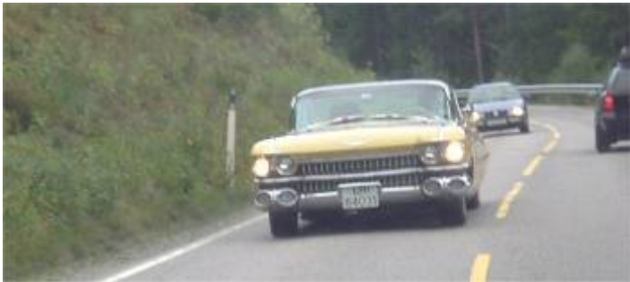
Odd Roar/Arne Roger/Fred

Dagen derpå, ble nok dagen derpå for en del. Det ble en stille frokost på de fleste og så tok vi fatt på veien hjem.