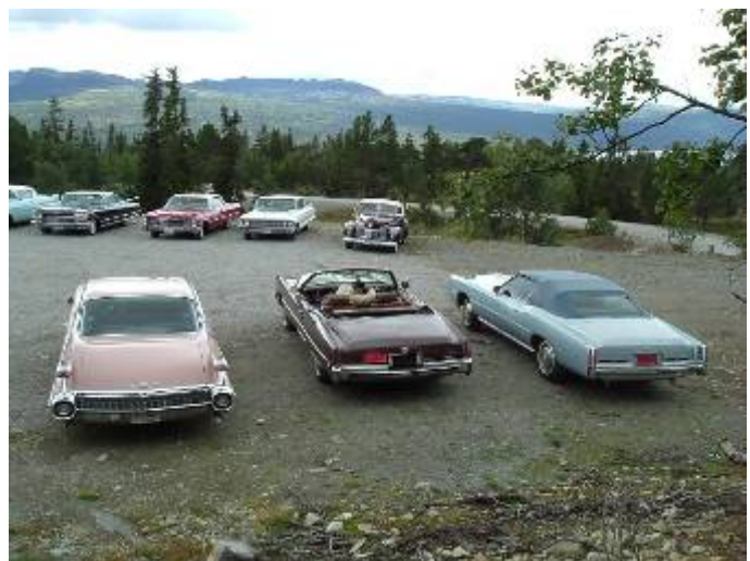
Bilene samlet på parkeringsplassen utenfor Langedrag.