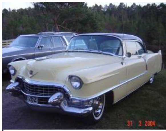
Per Arne's 55' Coupe deVille.

Like etter dette bildet ble tatt kjørte vi med stø kurs for Rhusy's Drive Inn for en hamburger eller to. 100 meter fra rasteplassen tar en bil fyr i motorrommet. Per Arne Hustelid's 55' Coupe deVille brenner. Rune og Gry Ulleland ser hva som skjer og stopper og får gjort Per Arne oppmerksom på hva som skjer. De som er i bilen ser ikke hva som skjer på grunn av flammene som går under bilen.